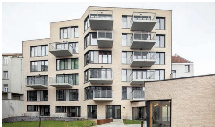
Projet « Arc-en-Ciel » de Fair Ground Brussels

Les usagers pourront devenir propriétaires de ces logements à moindres frais, grâce au modèle du Community Land Trust (voir article pp. 4-5). Les bâtiments seront ainsi retirés du marché de la spéculation immobilière.